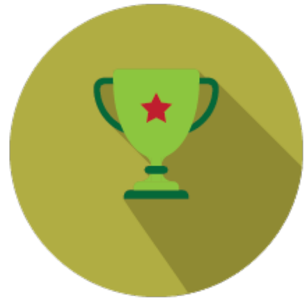
Сім'я, молодь та спорт