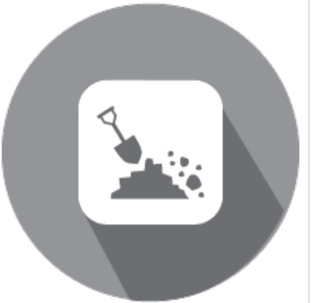
Будівництво, архітектура, землекористування